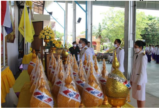
ภาพกิจกรรมวันศุกร์ที่ ๒๔ กรกฎาคม ๒๕๖๓ ณ.หอประชุมและลานโดมดอกคำใต้วิทยาคม