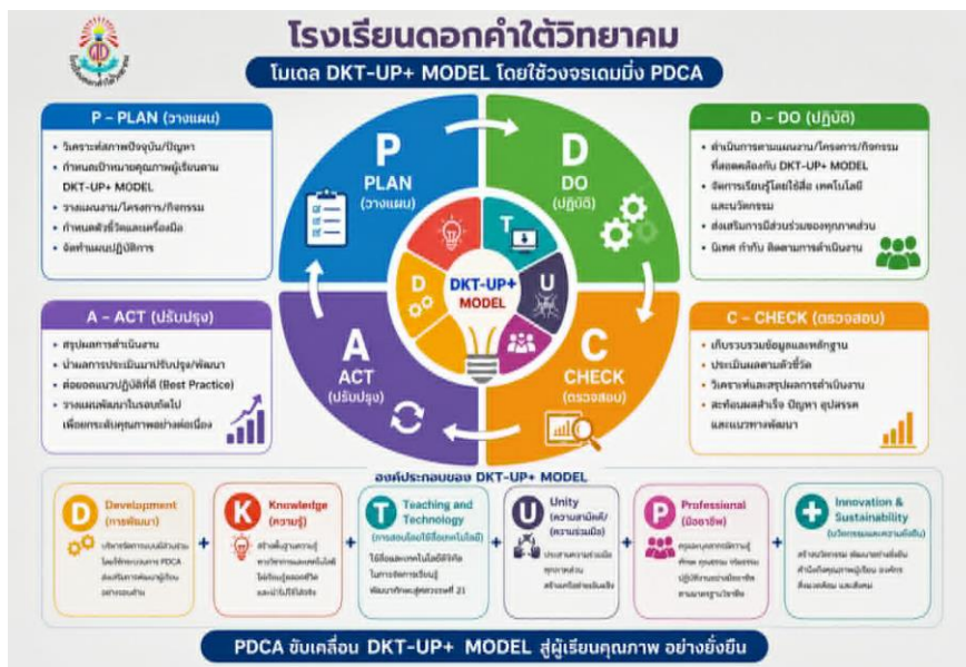
ภาพที่ 3 ภาพการแสดงกระบวนการบริหารจัดการระบบคุณภาพ DKT UP + MODEL

โรงเรียนดอกคำใต้วิทยาคม ใช้กระบวนการบริหารจัดการระบบคุณภาพ DKT UP + MODEL รายละเอียดดังนี้