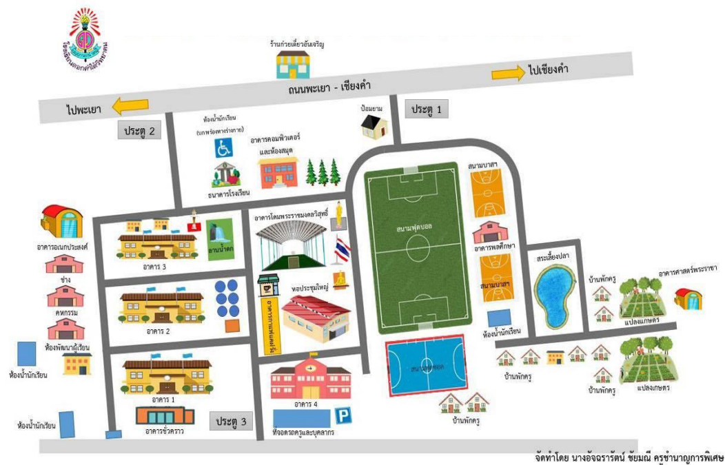
ภาพที่ 2 แผนที่โรงเรียนดอกคำใต้วิทยาคม